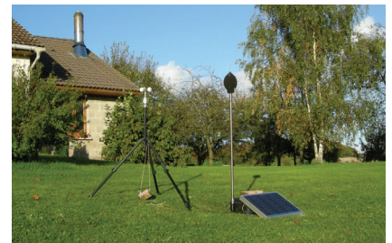
Installation des sonomètres près des habitations.

Modélisation de l’impact acoustique du parc. Estimation des émissions sonores en fonction de la géographie du site et des caractéristiques techniques des éoliennes.